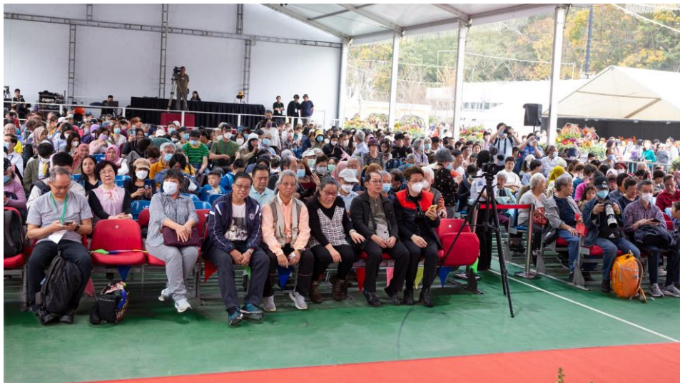
講座當天場面熱鬧非常