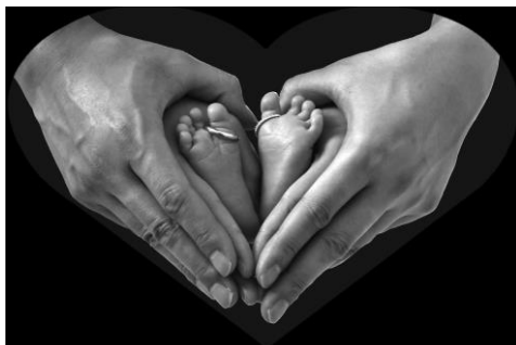
銀獎 毛耀樑 (Papa ,mama and baby)