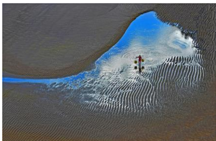
金獎 蘇樹富 (美麗的線條)