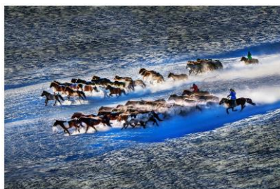
優異 楊啟源 (駿馬奔馳)