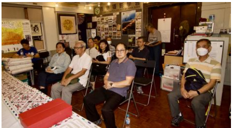
八月份月會評審嘉賓及出席觀賽的會友