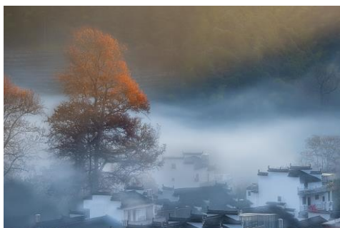
優異 麥國華 (春霧正濃)