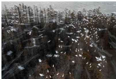
銀獎 蘇樹富 (鳥倦知還)