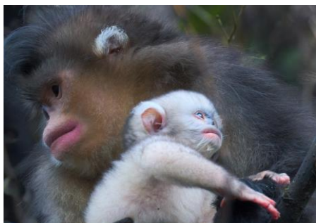
金獎 梁平 (母與子)