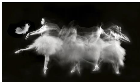
優異 蔡惠霞- (舞出真我)