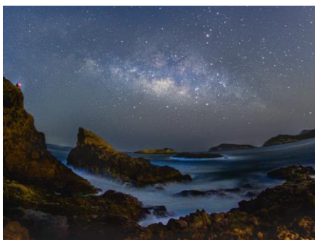
銅獎 毛耀樑 (Sky is laughing, sea is crying)