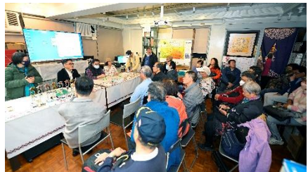
二月份月會評審嘉賓及出席會友