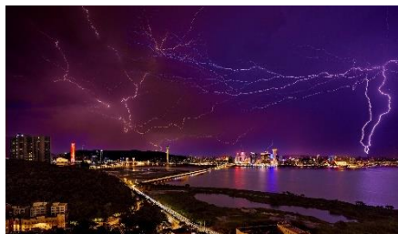
優異 陳子彬(God of Thunder)