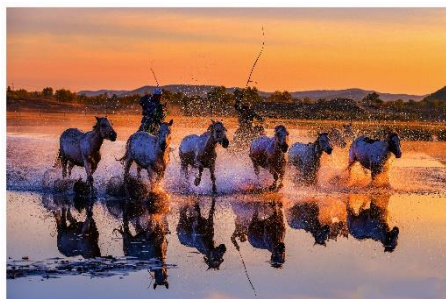
銅獎 楊啟源 (駿馬踏水)