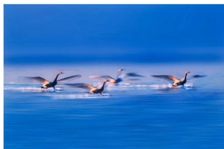
優異 楊啟源 (碧水飛馳)