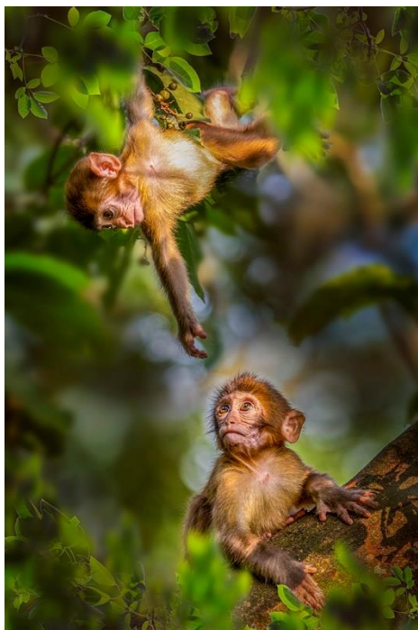
金獎 蔡惠霞 (童年)