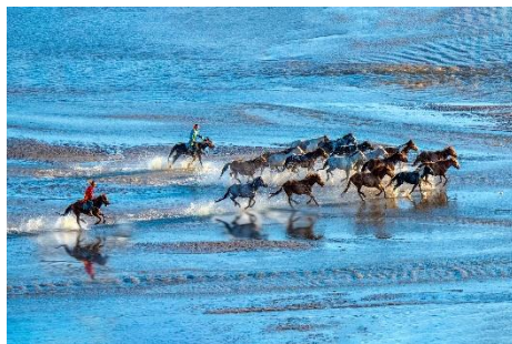
銀獎 嚴鎮波 (晨曦趕馬)