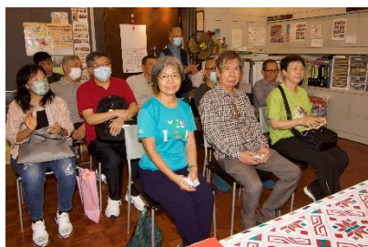
十月份月會評審嘉賓及出席觀賽的會友