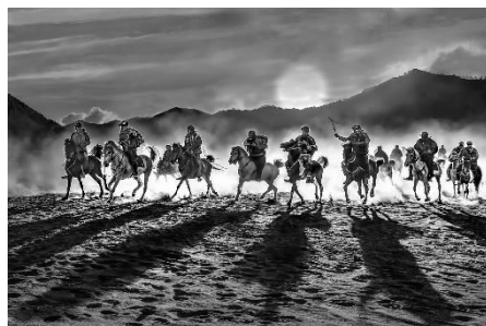
優異 何漢明 (夕照歸途)