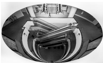
優異 蔡惠霞 (漫漫長路)