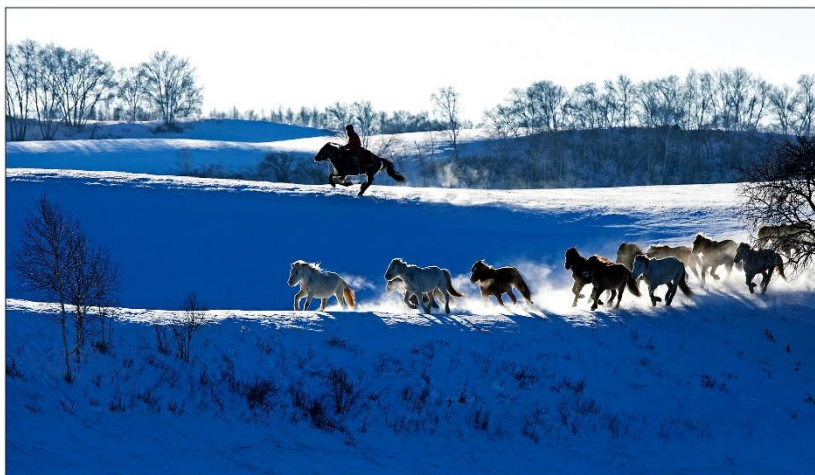
金獎 蘇樹富 (一馬當先)