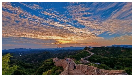
優異 嚴鎮波 (長城日落)