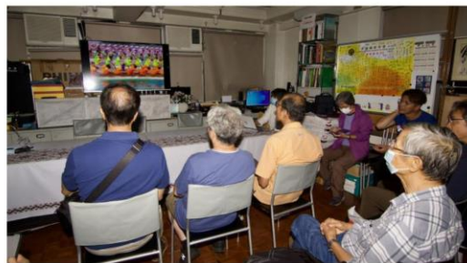
8月份月會評審嘉賓及出席觀賽的會友